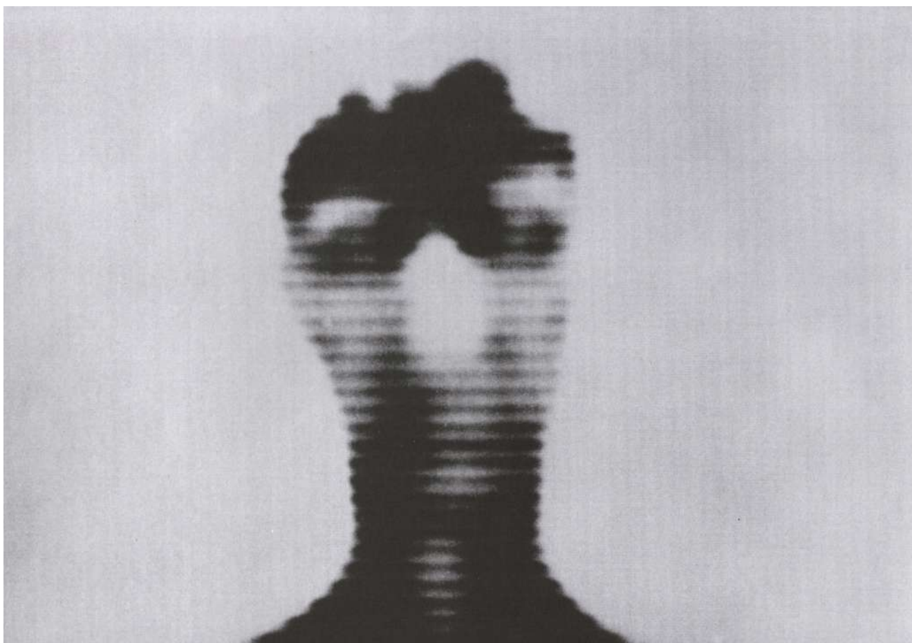
David Byrne-Jerry Harrison, Thermograph, Inner cover concept, Talking Heads, Fear of music, 1979.