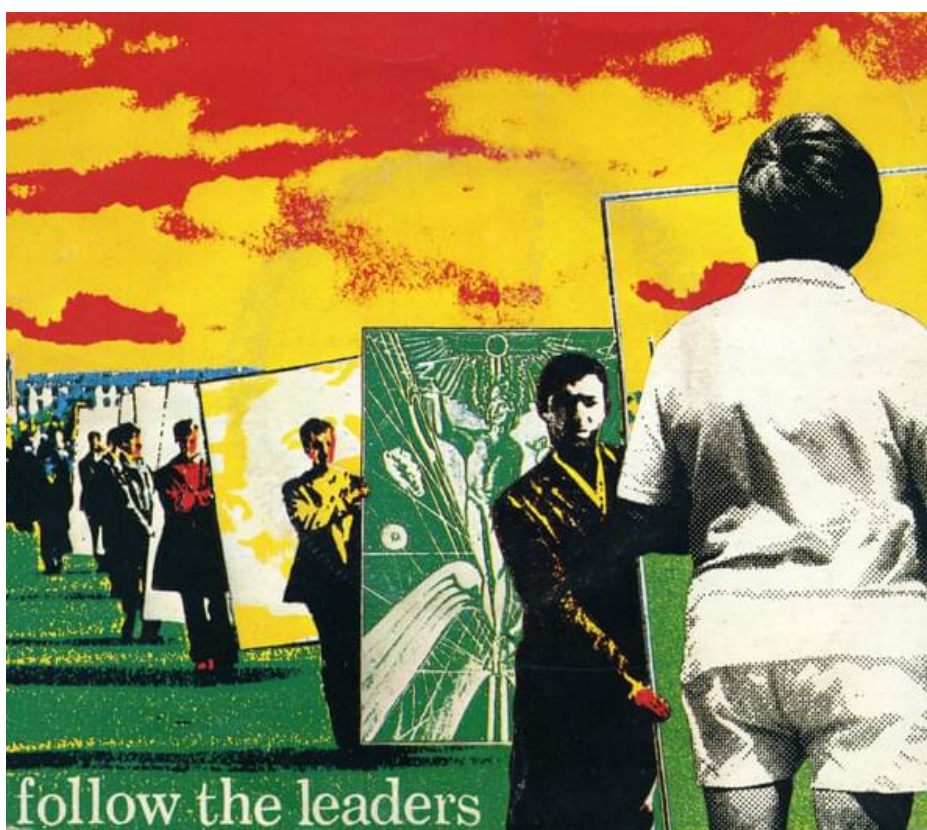
Cover del singolo Follow the Leaders, Killing Joke, EG Records (1981)