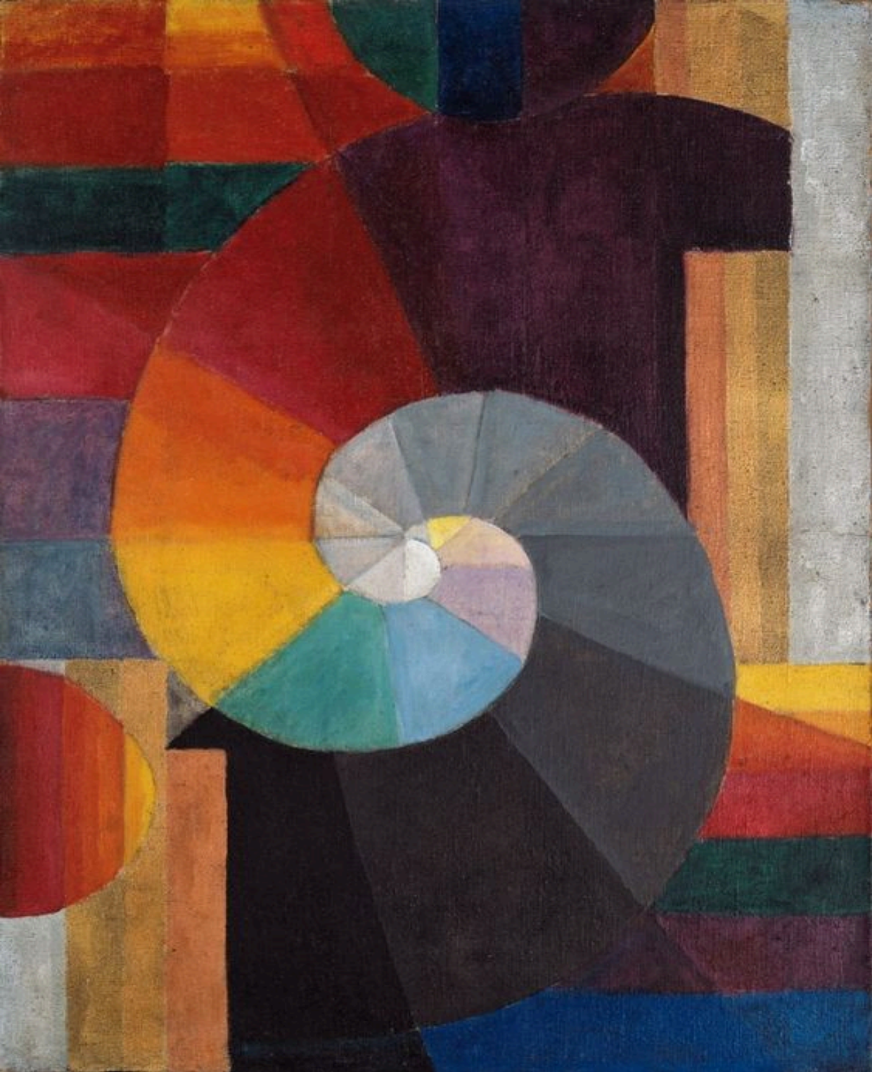
Paul Klee, Die Begegnung, 1916